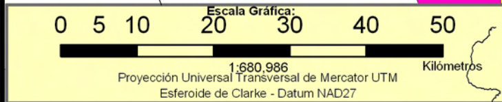
INCIDENCIA DE LA POBREZA EXTREMA POR HOGAR SEGÚN BARRIO Y COMARCA