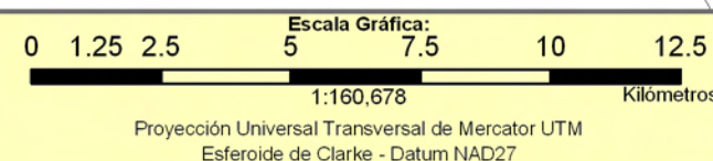
INCIDENCIA DE LA POBREZA EXTREMA POR HOGAR SEGÚN BARRIO Y COMARCA