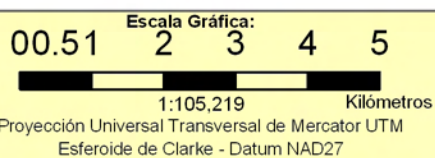
INCIDENCIA DE LA POBREZA EXTREMA POR HOGAR SEGÚN BARRIO Y COMARCA