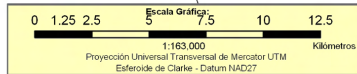
INCIDENCIA DE LA POBREZA EXTREMA POR HOGAR SEGÚN BARRIO Y COMARCA