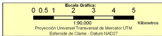
INCIDENCIA DE LA POBREZA EXTREMA POR HOGAR SEGÚN BARRIO Y COMARCA