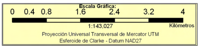
INCIDENCIA DE LA POBREZA EXTREMA POR HOGAR SEGÚN BARRIO Y COMARCA