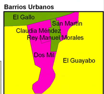
INCIDENCIA DE LA POBREZA EXTREMA POR HOGAR SEGÚN BARRIO Y COMARCA