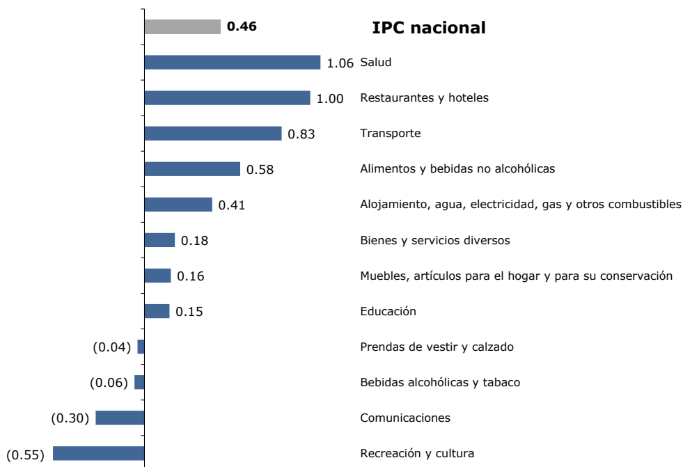
Inflación mensual por divisiones en mayo de 2020 (variación porcentual)